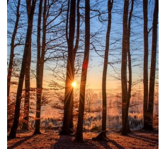
Nos « Robison Crusoé » et leur cabane...