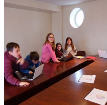
Un conte de Noël en préparation...